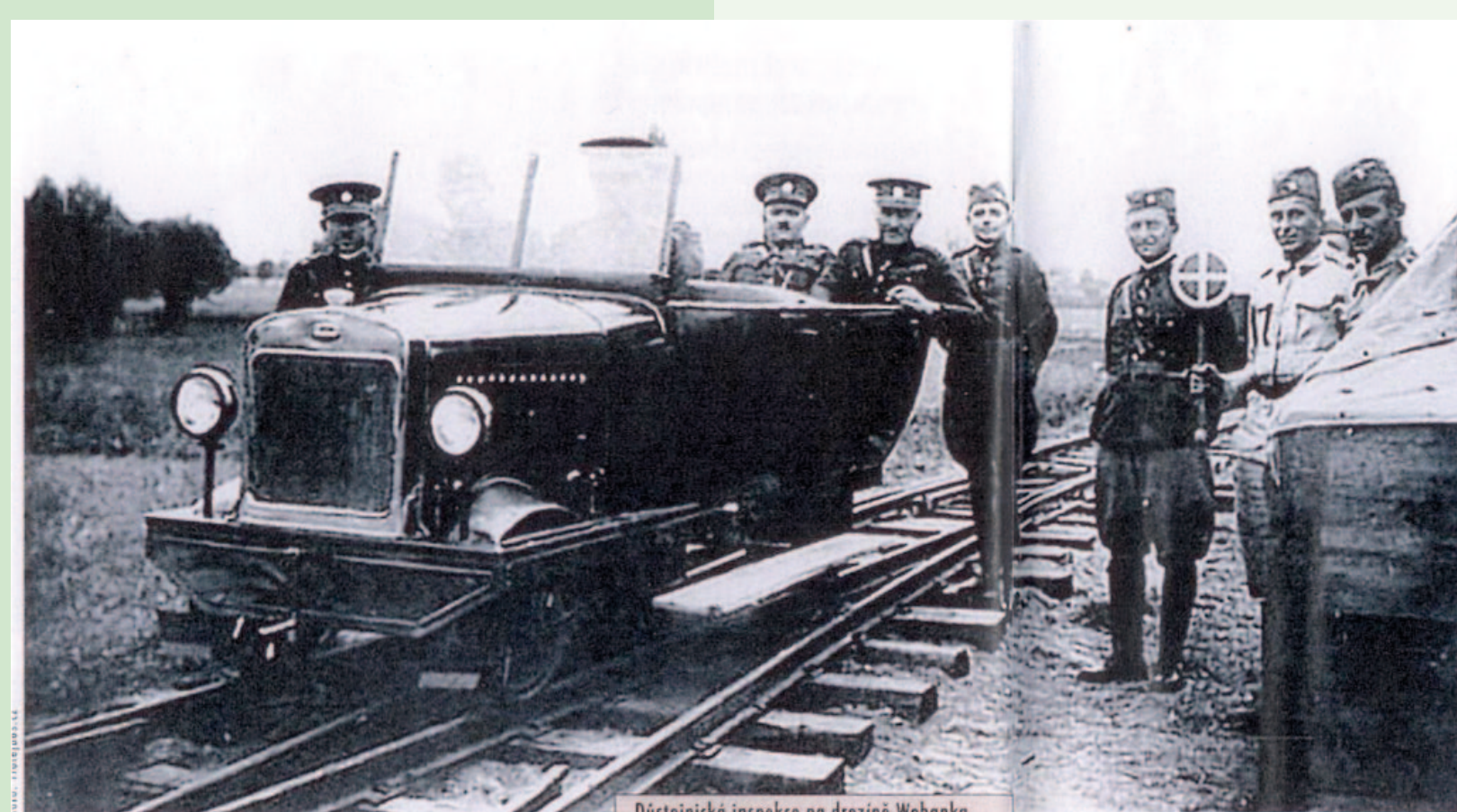
Firma Wohanka vyráběla mmj. Dreziny