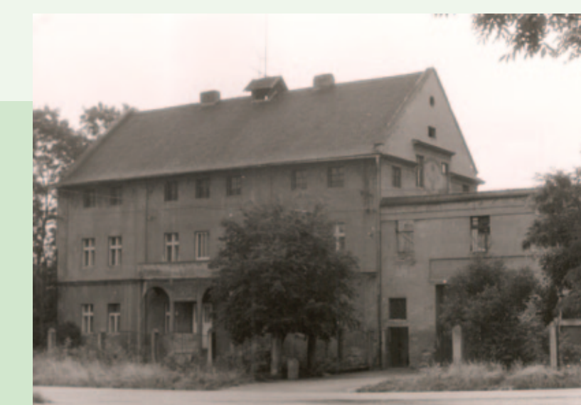
Objekt (č. p. 14) před a po rekonstrukci

Dalšími zajímavými objekty jsou bývalá kovárna č. p. 12 a jeden z největších statků v Poleradech č. p. 14, který byl v 90-tých letech přestavěn na bytový dům. Fotografie znázorňují stav před a po rekonstrukci.