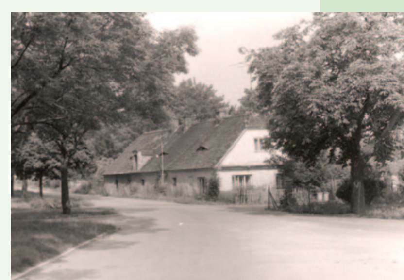
Bývalá obecní kovárna (č. p. 12) před a po rekonstrukci

Budova byla postavena obcí na obecním pozemku již v roce 1701. Ke kovárně patřilo několik polí a malé hospodářství. Později se dostala do soukromých rukou a během staletí měnila majitele, přičemž docházelo k dílčím rekonstrukcím. Zásadní nedávná rekonstrukce proběhla na poslední chvíli. Na následujících obr. je zřejmý stav před a po rekonstrukci.