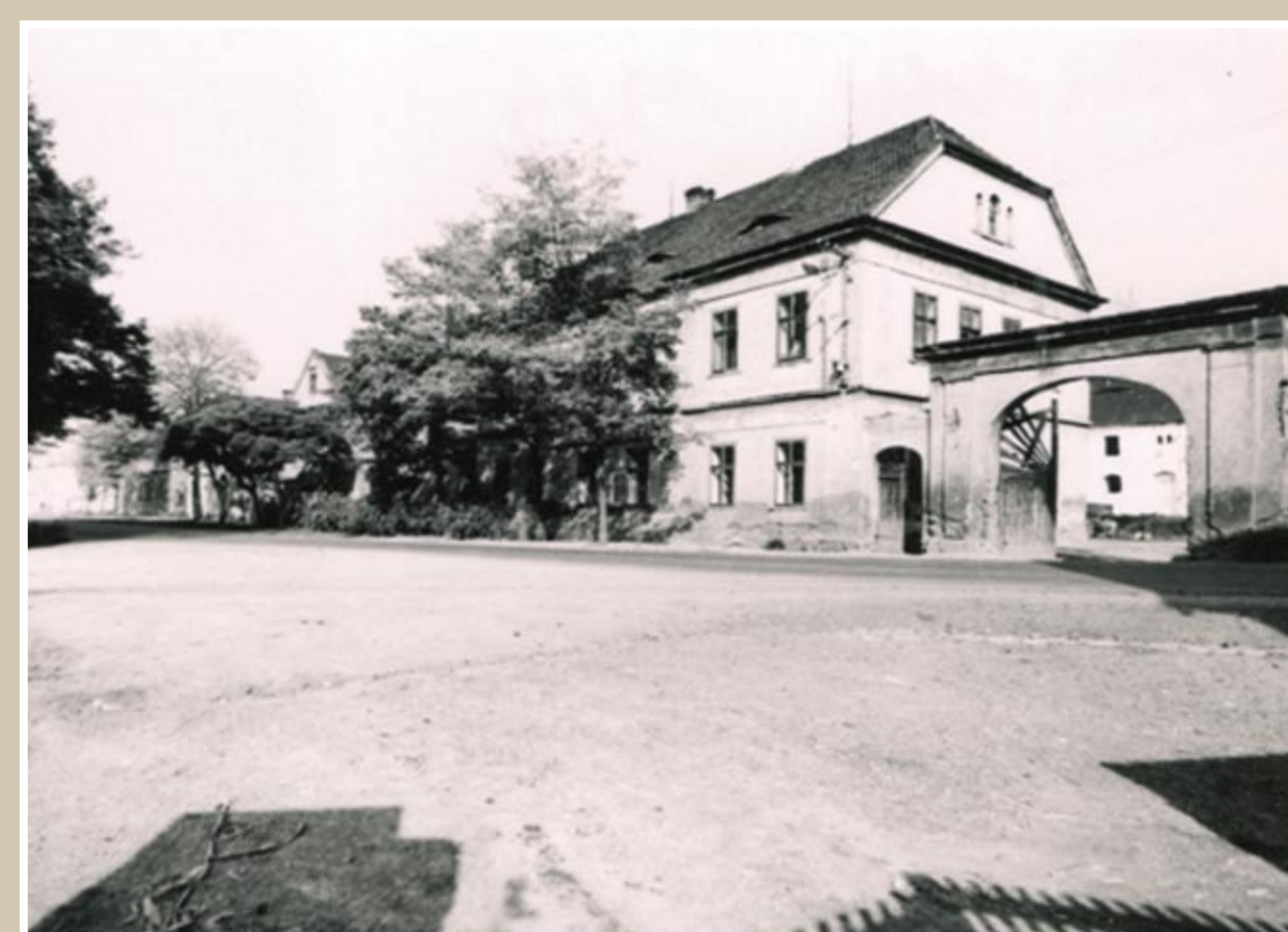
Objekt č. p. 10 – dobová fotografie

Statek na Kozím Ringu – jeden z největších a nejstarších statků v obci, na místě stál statek již od 17. století. Zajímavostí jsou výše zobrazené velmi zachovalé původní betonové nádrže na krmivo.