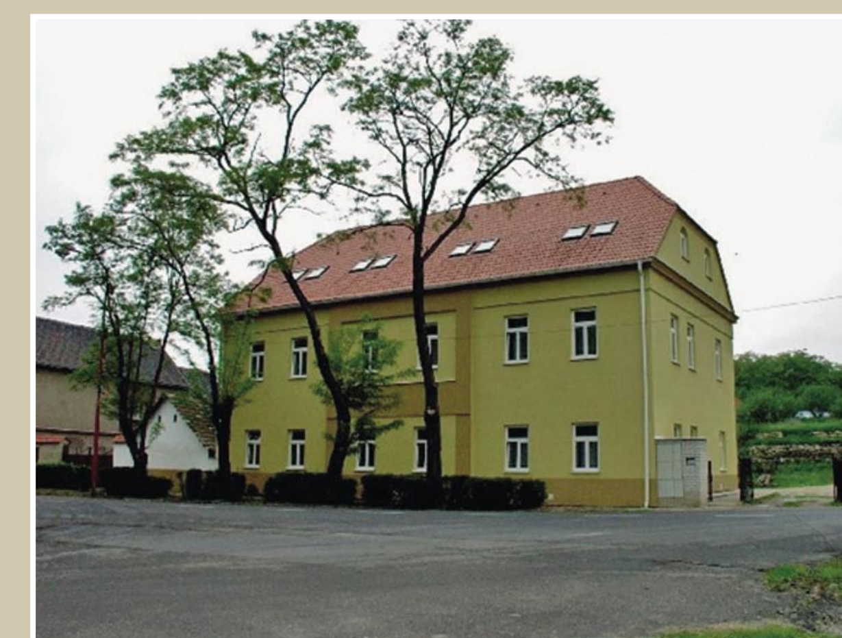
Objekt č. p. 10 – současný stav