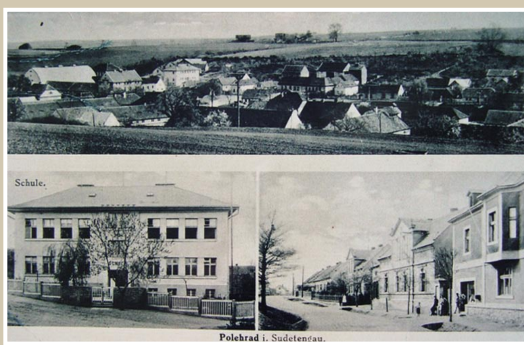
Pohlednice s celkovým pohledem na Polerady od severu, česká škola (s německým nápisem Schule) a ulice okolo domů č. p. 101