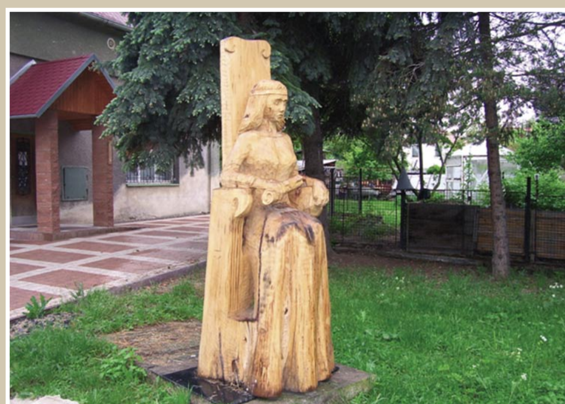
Anna Poleradská – řezbářské symposium v Poleradech