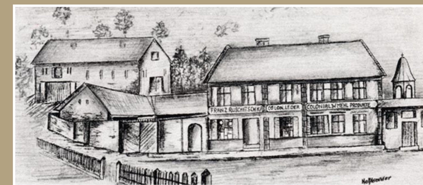
Pohled na jednu ze zaniklých usedlostí – vpravo kaplička a koloniál Ruschitschka

Zápisy z jednání v Litoměřicích a v Římě i zachráněné vybavení kapličky čeká na své znovuobjevení. Kaplička byla zasvěcena svatě Anně.