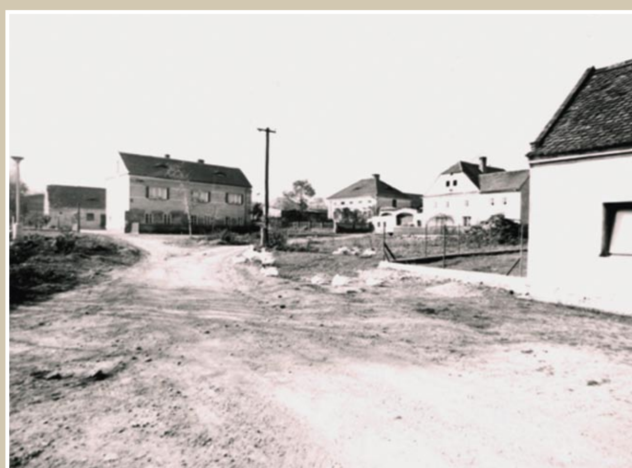
Kozí Ring – 70. léta