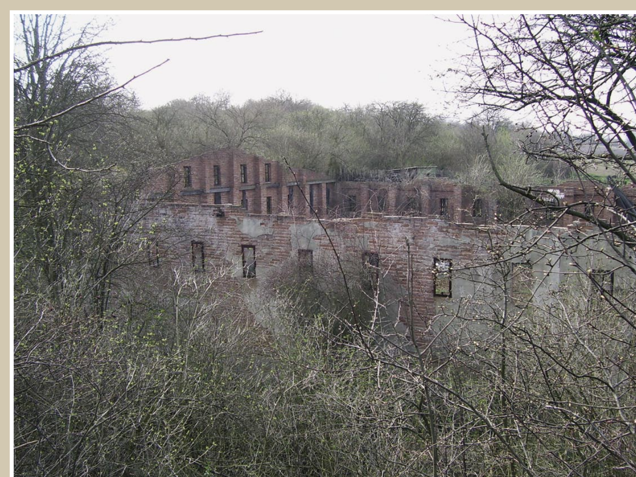
Zbytek původní výrobní haly, kde se vyráběly především klasické ruční vodní pumpy