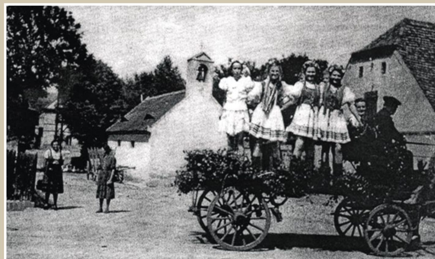
Dobová fotografie z poleradské návsi – v pozadí „hasičárna“ s věžičkou, vpravo štít staré školy