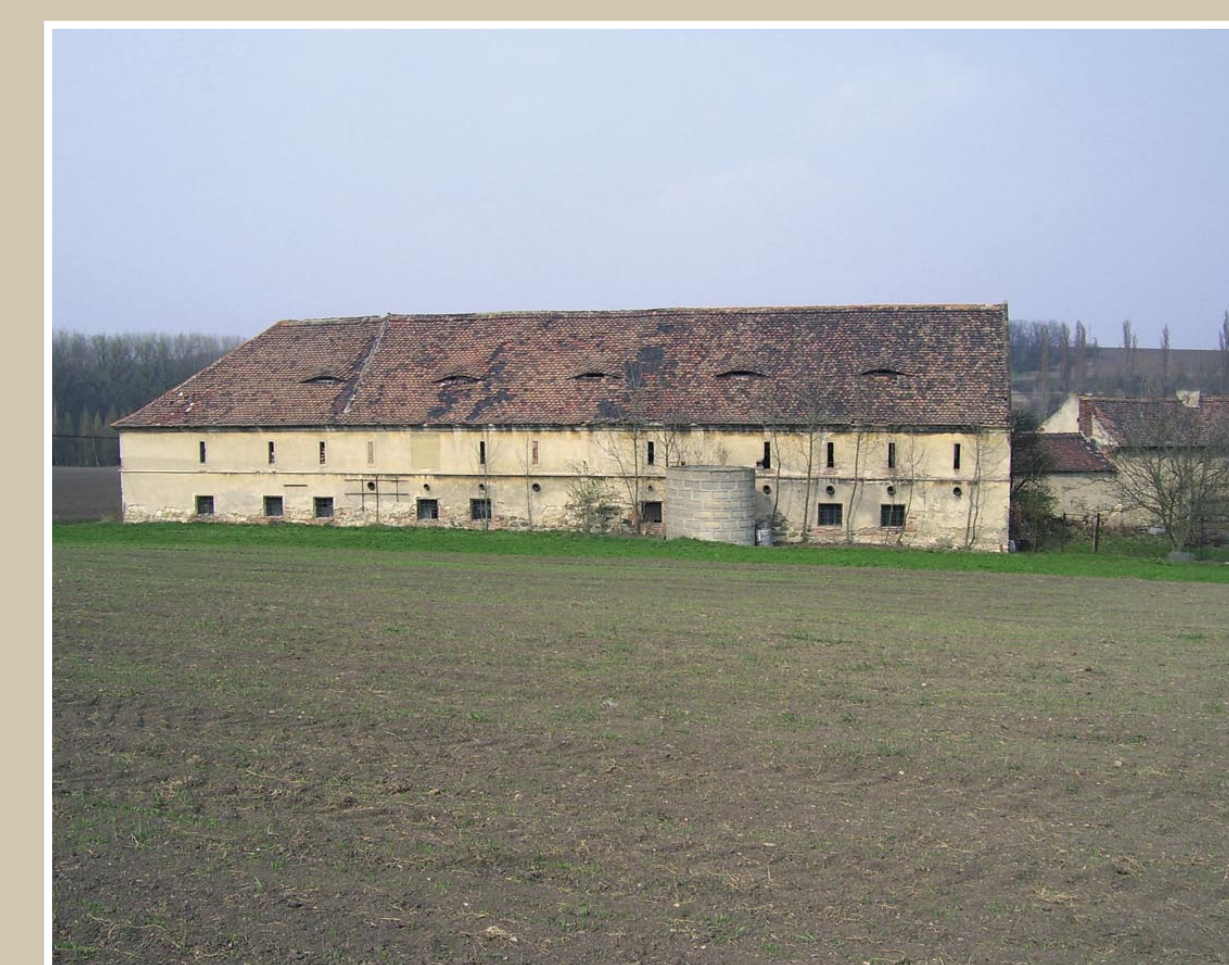
Zachovalé betonové nádrže na krmivo