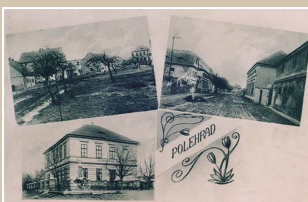
Pohlednice Polerad z počátku 20. století