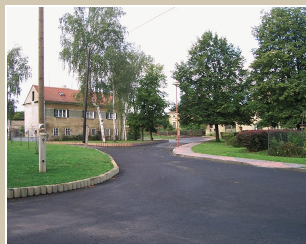
Kozí Ring – současnost