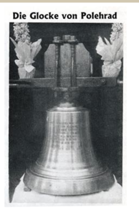
Poleradský zvon z roku 1921